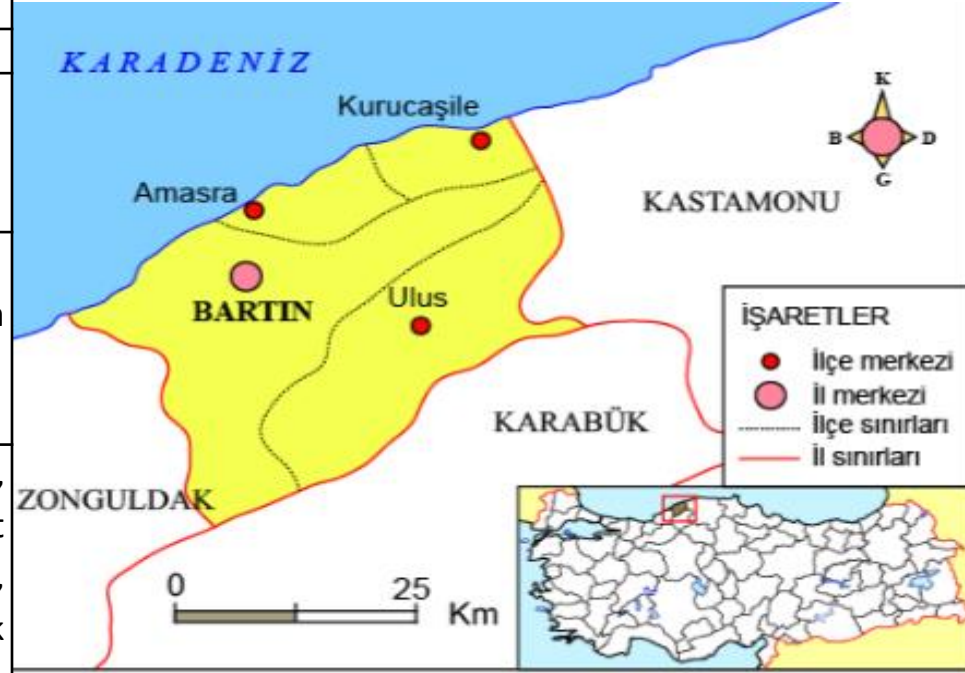
BARTIN İLİ HARİTASI