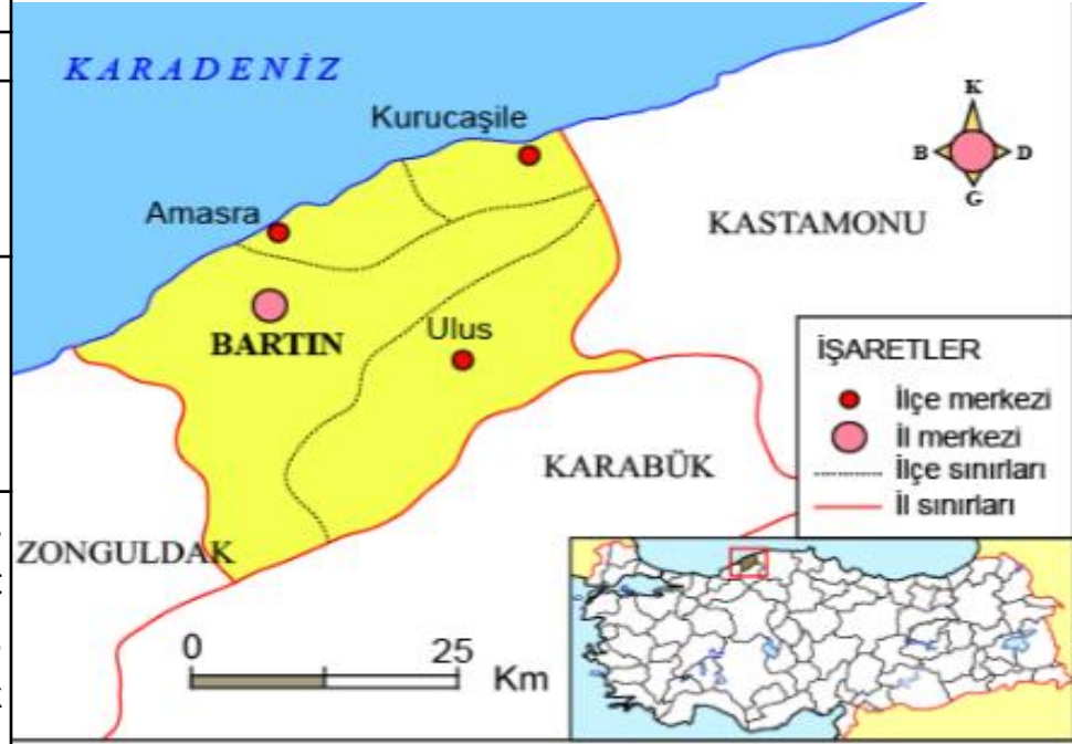
BARTIN İLİ HARİTASI