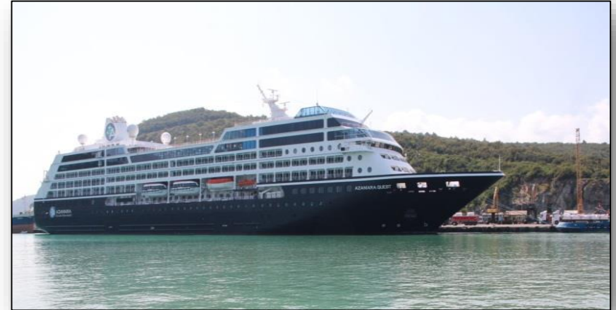
Azamara Quest Yolcu Gemisi, Bartın Limanı 2014